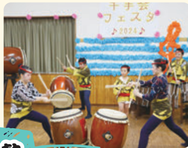
大江戸助六流 佐倉勇翔太鼓