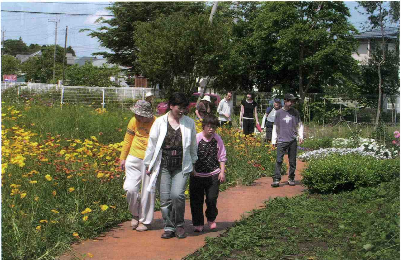
〈体力づくり ～ケア・ガーデン〜〉