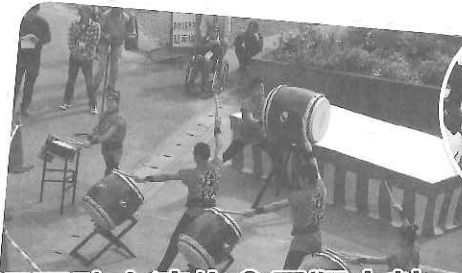
大江戸助六流佐倉勇翔太鼓