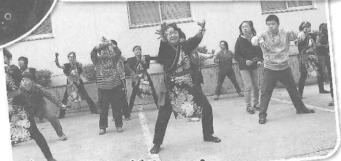
八幡台ロックソーラングループ