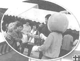
井野中学校吹奏楽部